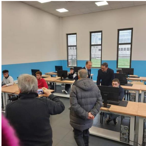
Laboratorio di CAD-CAM